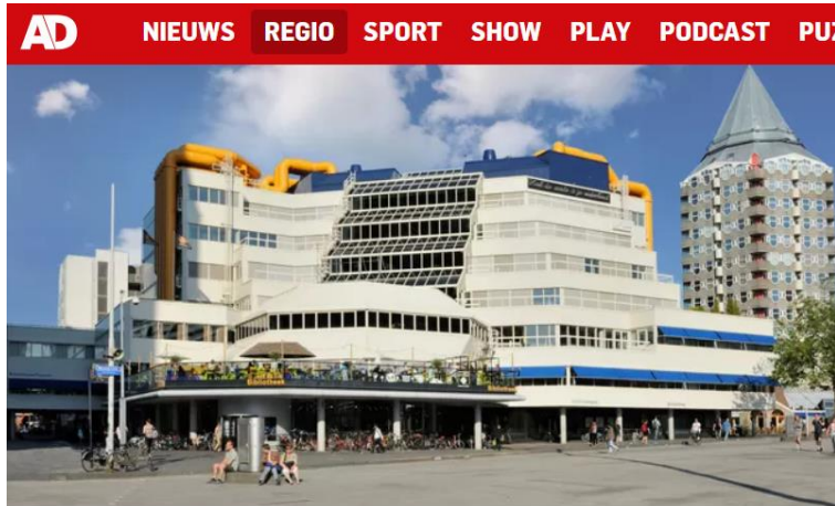
▲ De centrale bibliotheek van Rotterdam.