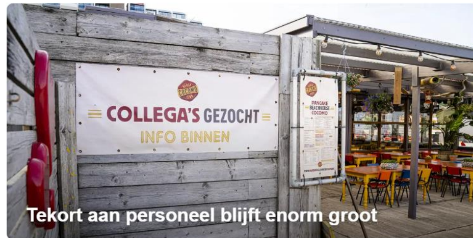
Tekort aan personeel blijft enorm groot